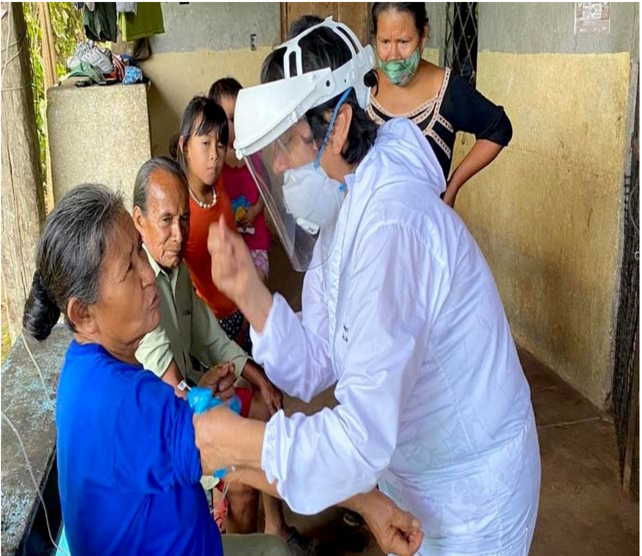
Miembros de la comunidad reciben consejos médicos y pruebas covid en una clínica móvil.