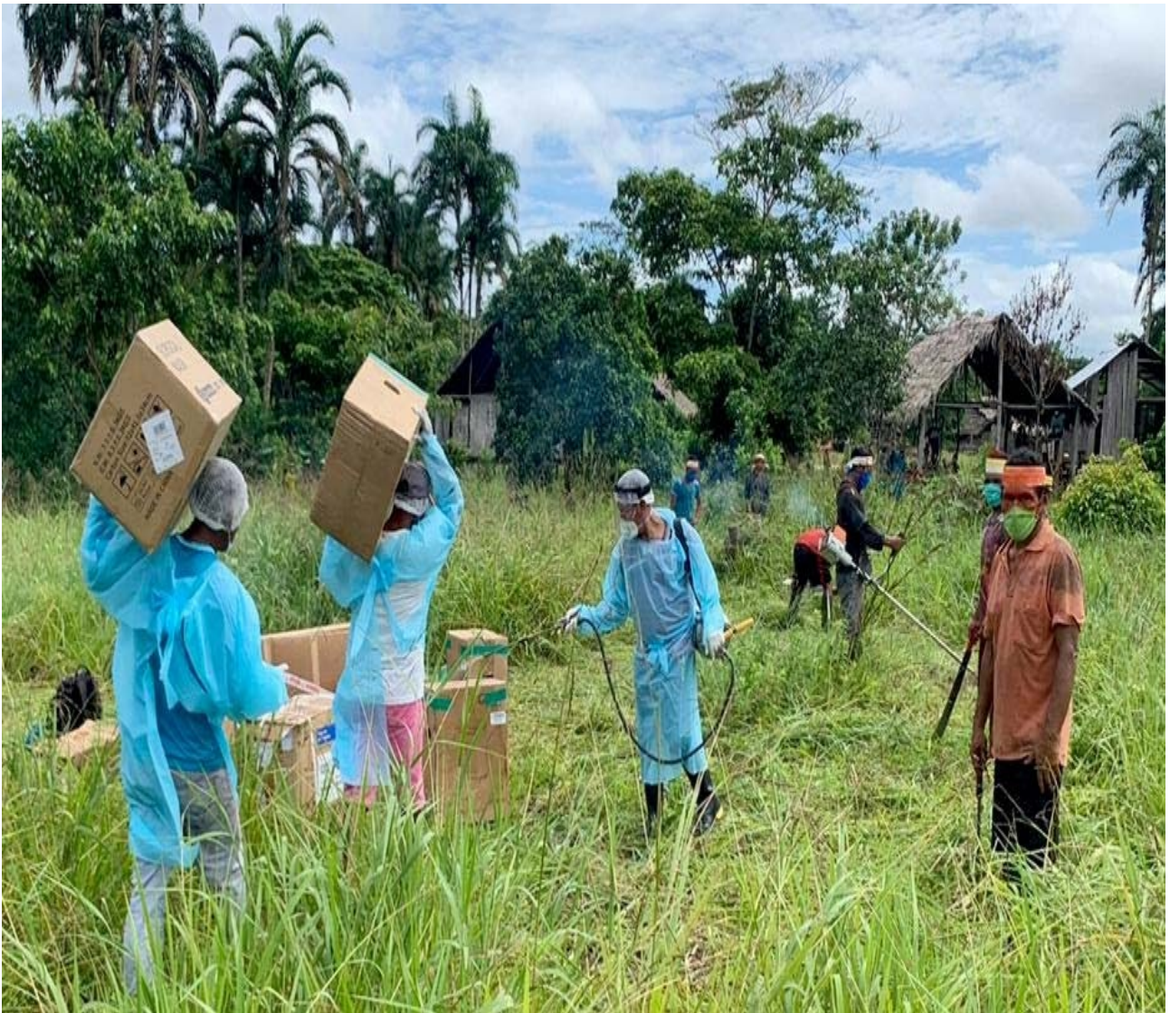
Los equipos médicos se desinfectan y se entregan a una de las muchas comunidades indígenas a las que ya hemos ayudado juntos.