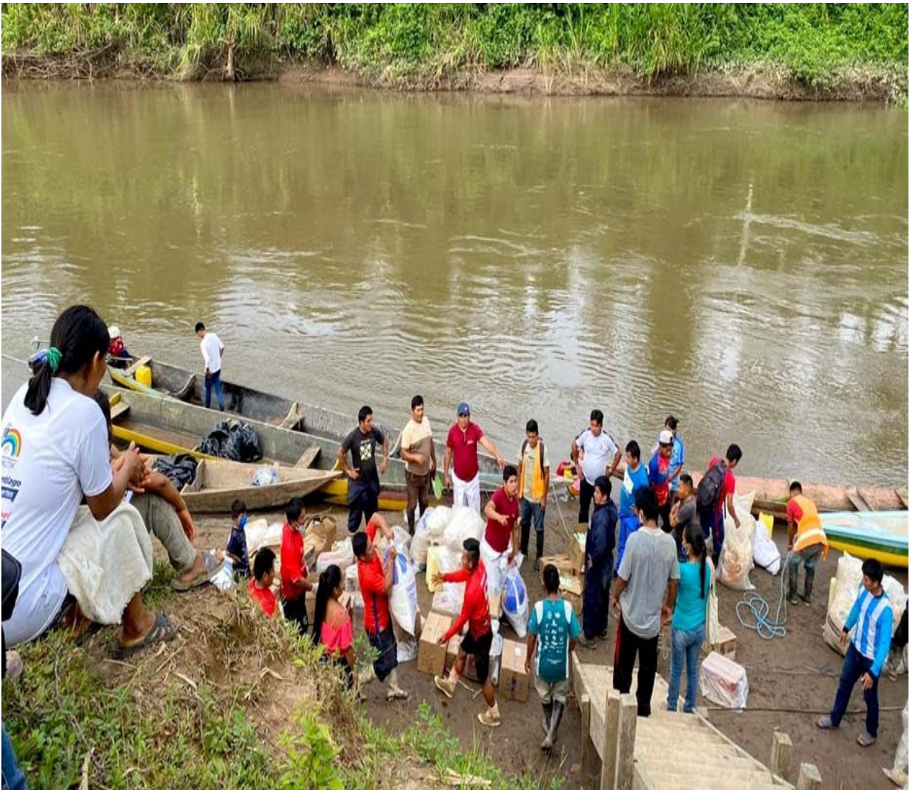
No hay carreteras en lo profundo de la Amazonía, así que las ayudas alimentarias y médicas se envían en canoas.